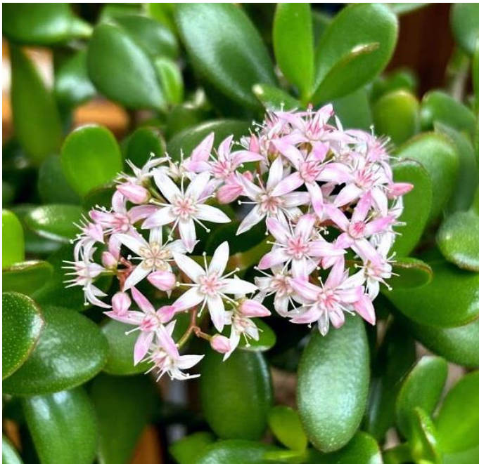
一株のカネノナルキに花が咲く